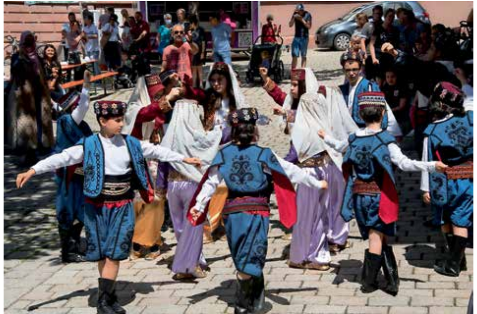
In aufwändigen Trachten stellten türkische Kinder Volkstänze vor.

Die vier Speisestände luden ein zu serbischen Spezialitäten wie Cevapcici im Fladenbrot oder Pita in verschiedenen Geschmacksrichtungen, afrikanische Gumenfreuden wechselten sich mit einer ukrainischen Suppe und italienischer Pinsa ab. Es war für jeden Geschmack etwas dabei. Erst am Abend klang das Fest langsam aus.