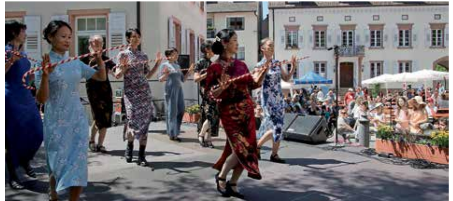
Premiere beim Internationalen Fest:

Chinesische Frauen zeigten traditionelle und moderne Tänze aus ihrer Heimat und die Jagdhornbläser Gruppe Markgräflerland